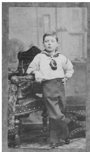
Winston Churchill en 1881, à l'âge de 7 ans

Comme pour chaque exposition du musée de l'Armée, multimédias et panneaux spécifiques jalonnent les espaces de l'exposition pour permettre aux enfants, dès 9 ans, de découvrir les grands thèmes liés à Churchill et de Gaulle. Ils auront ainsi des clefs de lecture pour découvrir et décrypter les objets, les affiches ou les archives présentés. Un livret-jeux et des visites guidées leur seront par ailleurs proposés.