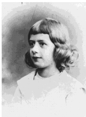
Charles de Gaulle, à l'âge de 7 ans