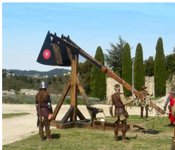
Démonstration d'un couillard médiéval

Présentation de l'artillerie actuelle avec manœuvre du canon Caesar (CAmion Equipé d'un Système d'ARtillerie et d'un Mistral (Missile Transportable Antiaérien Léger) sur une plateforme. Hommage à « l'opération Sentinelle ».