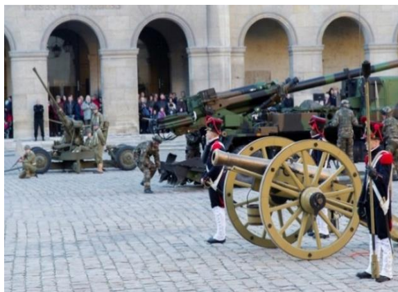
Démonstration d'artillerie contemporaine et d'un canon du système Gribeauval