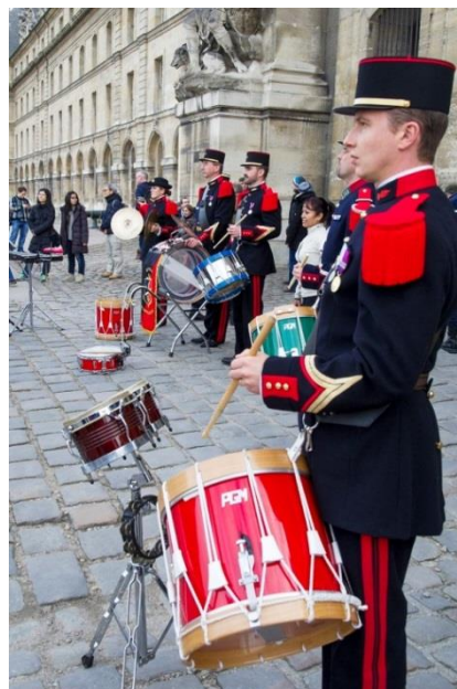
La fanfare de l'Ecole d'Artillerie aux Invalides

En l'an 235, Barbe, une belle et noble jeune fille de Nicomédie, dans l'actuelle Turquie, aurait été enfermée dans une tour par son père, Dioscore, pour la soustraire aux sollicitations du monde. De retour d'un voyage, apprenant qu'elle s'est convertie au catholicisme, il la livre au Gouverneur. Ce dernier la fait supplicier et décapiter par son propre père, qui est aussitôt frappé par la foudre et réduit en cendres. Au fil des âges, la tour finit par se confondre avec une poudrière, et Barbe, devenue sainte, est élue patronne des artificiers, des armuriers, des artilleurs, des mineurs et des sapeurs-pompiers. Elle est invoquée pour conjurer le tonnerre et les éclairs, ainsi que pour les accidents liés à l'explosion de la poudre à canon. Elle est fêtée chaque année le 4 décembre.