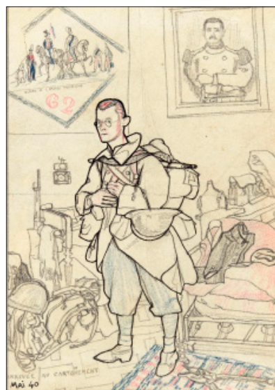
Jean Delpech, Arrivée au cantonnement

En 2019, la famille de Jean Delpech s'est rapprochée du musée de l'Armée et lui a proposé d'acquérir les œuvres de guerre de l'artiste. Cet ensemble constitué de plus de 400 dessins et gravures datés entre 1935 et 1958, témoigne de l'influence qu'a pu avoir la Seconde Guerre mondiale sur le travail de l'artiste. Le Musée conservait jusqu'alors un fonds de 434 œuvres données par l'artiste en 1972, au moment de l'ouverture des salles consacrées à la Seconde Guerre mondiale.