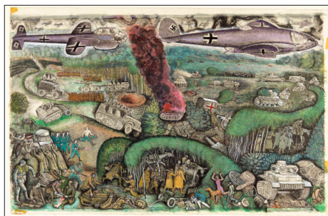
Jean Delpech, Campagne de France , 1940

Cette éditorialisation se déploie sur les trois étages du parcours permanent consacré à la Seconde Guerre mondiale. Elle vise à présenter l'art de Jean Delpech en une quarantaine d'œuvres, invitant le visiteur à découvrir l'itinéraire de l'artiste pendant le conflit et son regard original sur cette période. Étudiant aux Beaux-arts de Paris depuis 1936, Delpech est mobilisé chez les chasseurs alpins de 1938 jusqu'à la fin de l'année 1940. L'artiste, qui vit ensuite à Paris sous l'Occupation, produit un travail quasi ethnographique sur la guerre, croquant la vie quotidienne d'un pays occupé.