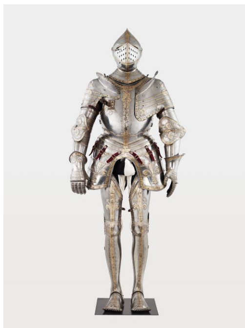
Armure de François I er