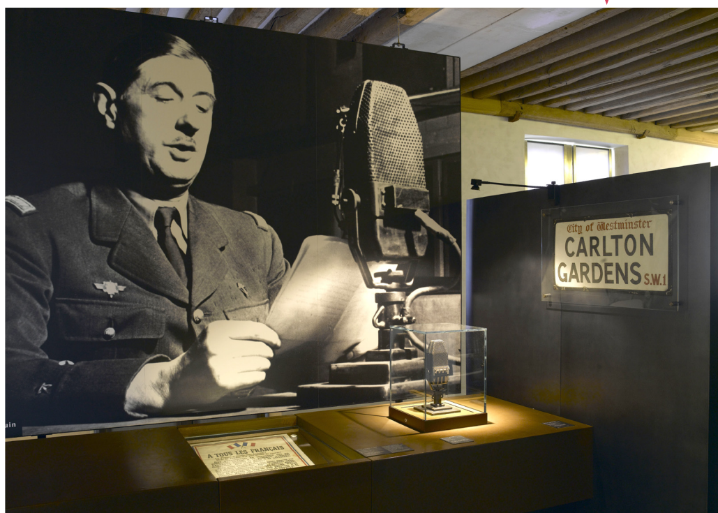
Espace « Appel du 18 juin », 3 e étage © Musée de l'Armée/RMN-GP.