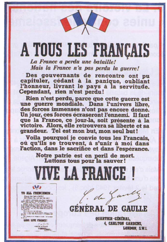
1 Affiche « A tous les Français... » dite « Appel du 18 juin », imprimée par J. Weiner Ltd, Londres, Novembre 1940. Inv. Gau 11 © Musée de l'Armée/RMN-GP.

Quartier général - 4, Carlton Garden, London, S.W.1