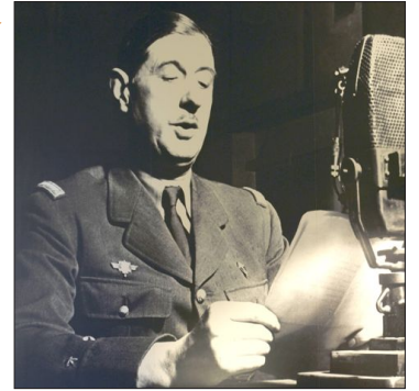
Général de G _ _ _ _ _

Le 18 juin 1940, réfugié en Angleterre, il lance un appel à la Résistance* contre l'Allemagne nazie, depuis la radio anglaise, la BBC.