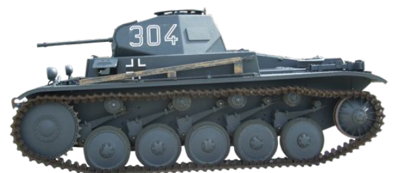
Char allemand, Panzer II modèle F