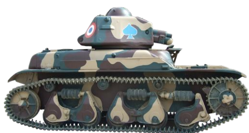
Char français, Renault type R35

Indice : regarde les cartels (petits panneaux donnant des informations sur un objet. Ils sont situés sur les socles sombres).