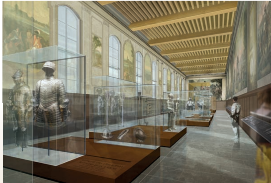
Projet de salle rénovée du département des armes et armures