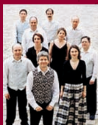
Les Folies Françaises

CONDITIONS D'ACCÈS : 15 €, 10 € sur réservation téléphonique préalable impérative au 01 44 42 48 14 (répondeur)