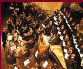
Ensemble LE PARNASSE FRANÇAIS

CONDITIONS D'ACCÈS : entrée libre sur réservation téléphonique préalable impérative au 01 44 42 48 14 (répondeur)