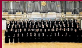
Chœur de la philharmonie slovaque

CONDITIONS D'ACCÈS : 18 € (tarif unique), sur réservation téléphonique préalable impérative au 01 44 42 48 14 (répondeur). Pas d'invitation