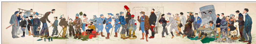
Henri Villain, dit Drévil (1882- ?), Frise des camoufleurs , 1916

L'hôtel des Invalides, fondé en 1670 pour soigner les soldats inaptes au service et loger les vétérans des guerres de Louis XIV, qui abrite aujourd'hui le musée de l'Armée et le tombeau de Napoléon I er sous le Dôme des Invalides, est également représenté dans le fonds du Musée. La collection élargit progressivement ses lignes, étendant son spectre à une réflexion plus large sur les représentations de la guerre et l'engagement des artistes.