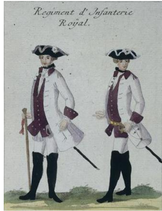
Régiment d'infanterie Royal, planche 25 du Recueil de toutes les troupes qui forment les armées françaises, 1761, estampes et aquarelle sur papier

Plus qu'un simple catalogue des objets conservés par le musée de l'Armée, cet ouvrage s'appuie sur ses collections pour brosser une histoire de l'armée française des XVII e et XVIII e siècles. Les objets y répondent aux acquis les plus récents de la recherche historique : remis dans leur contexte, ils contribuent à donner une dimension plus humaine au fait historique, mettant en lumière des destins que l'Histoire a parfois laissés de côté.