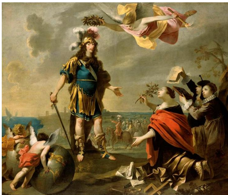
Jean Tassel, Louis II de Bourbon, duc d'Enghien, reçoit la reddition de Dunkerque, en octobre 1646

Bien plus qu'un catalogue d'objets au sens strict, cet ouvrage brosse l'histoire de l'armée française sous l'Ancien Régime en s'appuyant sur les objets, humbles ou grandioses, des collections dites « classiques » (XVII e – XVIII e ) du musée de l'Armée.