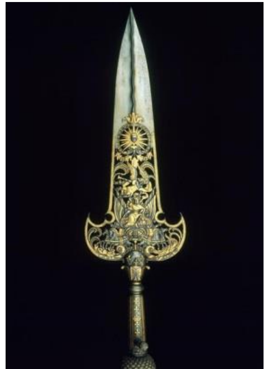
Pertuisane des Gardes de la manche