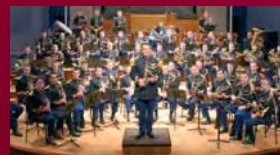
Orchestre d'harmonie de la GARDE REPUBLICAINE

Jeudi 8 février 2007 à 20h – Cath. St-Louis des Invalides