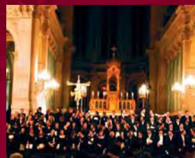
Choeur et orchestre des GRANDES ÉCOLES

CONDITIONS D'ACCES : 5€ (tarif unique), sur réservation téléphonique préalable impérative au 01 44 42 48 14 (répondeur)