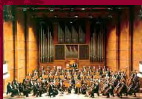
Orchestre de la PHILHARMONIE de SOFIA

CONDITIONS D'ACCÈS : entrée gratuite, sur réservation téléphonique préalable impérative au 01 44 42 48 14 (répondeur)