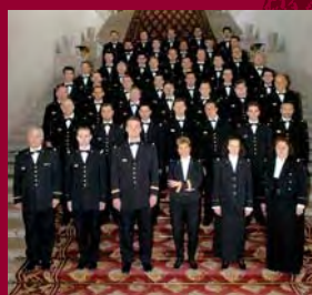
Choeur de l'ARMÉE FRANÇAISE

CONDITIONS D'ACCES : 5 € (tarif unique), sur réservation téléphonique préalable impérative au 01 44 42 48 14 (répondeur)