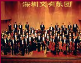
Orchestre Symphonique de SHENZHEN

SOUS LE HAUT PATRONAGE DE SON EXCELLENCE MONSIEUR ZHAO JINJUN, AMBASSADEUR DE CHINE EN FRANCE AVEC LE SOUTIEN DE LA MUNICIPALITE DE SHENZHEN