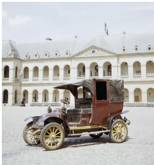
Taxi de la Marne dans la cour d'honneur de l'Hôtel des Invalides