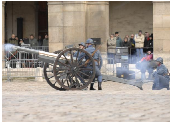
Artillerie de la Grande Guerre dans la cour d'honneur de l'Hôtel des Invalides