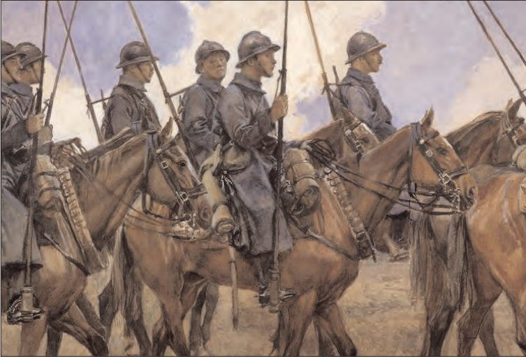
Dragons, Champagne, avril 1917, par François Flameng (1856-1923). Inv. 1035 C1 ; Eb1317. Crayon et gouache sur papier, H. 0.350 m x L. 0.560 m.