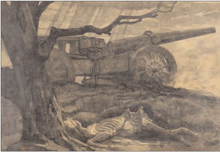
Canon de 155 long enlisé sur le champ de bataille en Macédoine après la prise de Monastir, novembre 1916, par Paul Jouve (1878-1973). Monastir, actuellement Bitola (République de Macédoine). Inv. 20960.3 ; Fb 1098. Aquarelle et encre sur carton, H. 0.650 m x L. 0.898 m.

Peintre et illustrateur animalier, il fait la guerre au 2 e zouaves, sur les champs de bataille du Nord, d'Artois et à Nieuport, avant de rejoindre l'armée d'Orient aux Dardanelles, en Grèce et en Bulgarie. En 1916, il est sergent et attaché au service photographique des armées alliées, mais aussi agréé comme peintre du musée de l'Armée. En décembre 1917, il quitte Salonique pour se rendre à Athènes, Delphes et Kalambaka.