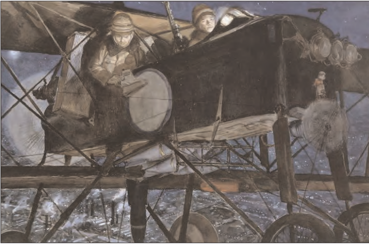
Bombardement de nuit par un avion de type Bréguet-Michelin, 1918, par François Flameng. Inv. 1175 C1 ; Eb 726. Aquarelle, carton, gouache, H. 0,310 m x L. 0,490 m.

En janvier 1916, il part pour l'Alsace, et gagne Verdun où on le trouve en février-mars, puis en juin, avant de revenir dans la Somme entre juillet et décembre. De la Marne, en février 1917, il gagne la Somme, Soissons, puis Lyon et l'Isère où il visite des installations industrielles. En avril-mai, il est en Champagne, autour de Reims et Soissons, en juillet-août sur les bords de l'Yser, à la fin de l'année de nouveau en Champagne. Il visite des champs d'aviation en janvier-février 1918, gagne l'Aisne et l'Oise en avril-mai, et encore en juillet-août, et séjourne également cette année-là autour de Reims et d'Arras 40 .