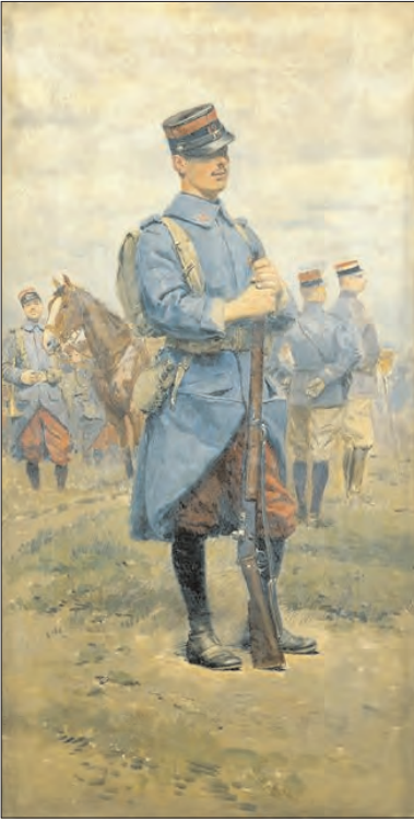
Fantassin du 12 e régiment en tenue de campagne, proposition pour les nouveaux uniformes de l'armée française, 1912 par Jean-Baptiste-Édouard Detaille (1848-1912). Inv. 01178 ; Ec 80 D

À la fin de l'année 1912, lorsque disparut Édouard Detaille, leur chef de file, les peintres militaires, ses amis, élèves ou émules, ressentant la menace d'une dispersion du genre, voire de sa disparition, entreprirent de se regrouper. Ils créaient, à la fin de l'année suivante, la Société des Peintres militaires, rassemblant une quinzaine d'entre eux 10 .