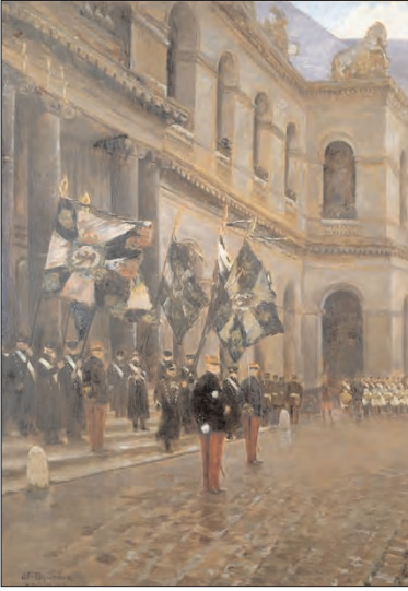
Remise solennelle au général Niox, commandant des Invalides, des six premiers drapeaux pris à l'ennemi, le 7 octobre 1914 par Joseph-Félix Bouchor (1853-1937) en 1914. Inv. 707 C1. Huile sur toile, H. 0.920 m x L. 0.650 m.