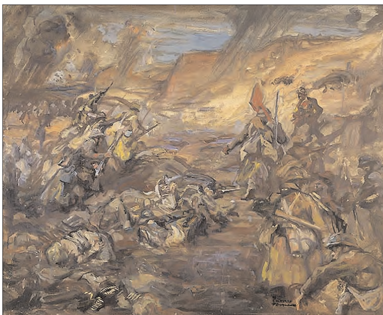
Le reprise du fort de Douaumont, par Dominique Charles Fouqueray (1872-1956). Esquisse du tableau commandé par l'État en 1923, à la demande de l'Union nationale des Combattants, pour le musée de Versailles et aujourd'hui perdu. Inv. 08856 C1 ; Eb 875. Huile sur toile, H. 0.600 m x L. 0.730 m.

Il est sur le front dès octobre 1914, sur l'Yser, à Dixmude, Ostende, Nieuport, et dans la Somme. Puis il rejoint l'armée navale et part pour l'Orient, en Syrie, Égypte, et à Constantinople. Il réalisera après la guerre une grande Prise du fort de Douaumont .