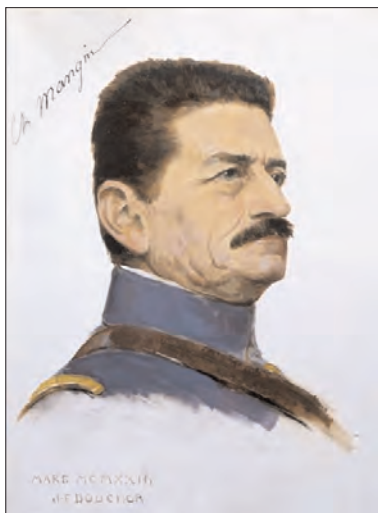
Le général Charles Mangin (1866-1925), 1923, par Joseph-Félix Bouchor (1853-1937). Inv. 1684 C1 ; Ea 2128. Peinture sur papier, H. 0.400 m x L. 0,320 m. 06-505560