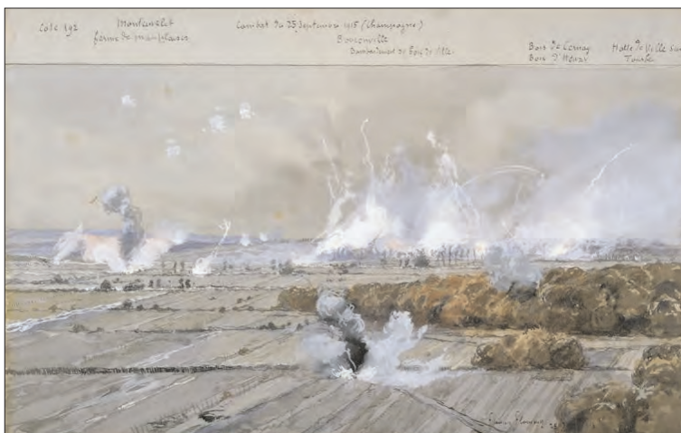
Combat du 25 septembre 1915, bombardement du bois de Ville-sur-Tourbe (Seconde bataille de Champagne) par François Flameng (1856-1923). Inv. 1125 C1 ; Eb 1228. Aquarelle et gouache sur carton, H. 0,300 m x L 0,450 m.

Les voyages, répétés de mois en mois, ont parfois été extraordinairement nombreux. Le cas de Flameng, quoiqu'un peu exceptionnel à certains égards, est néanmoins significatif par la fréquence des déplacements et la diversité des destinations : parti en décembre 1914 pour Reims, on le retrouve dans la région et autour de Soissons jusqu'en mai 1915. Il est ensuite dans le Nord et en Belgique entre la fin-mai et la mi-août, avant de gagner l'Argonne à la fin du mois, jusqu'à la fin septembre. Il est en Champagne en octobre-novembre, dans le Nord à nouveau en décembre.