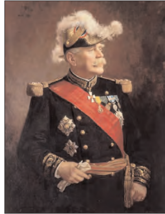
Joseph-Césaire Joffre, général de division, mars 1915 par Henry Jacquier (1878-1921). Inv. 28464 ; Ea 763.