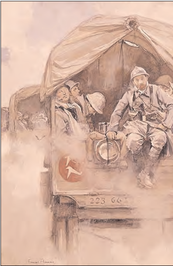
Sur la route de Verdun, 25 janvier 1916. Convois, route de Verdun à Bar-le-Duc, 25 janvier 1916 par François Flameng (1856-1923). Inv. 1099 C1 ; Eb 1362.1. Aquarelle, carton, gouache, H. 0.470 m x L. 0.320 m.