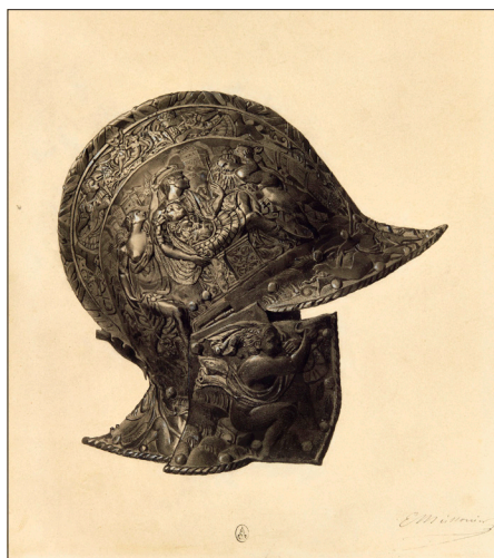
Jean-Louis Ernest Meissonnier (1815-1891), Bourguignotte avec un guerrier, l'Amour et la Gloire, 1843