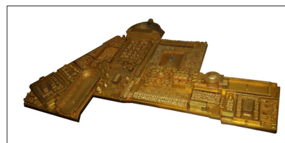
Éléments de la maquette originale de Rome en bronze de Paul Bigot