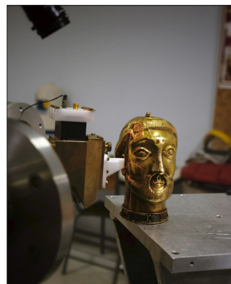
Analyses par microscopie Raman, crâne en cristal de roche, ancien département Amérique du Musée de l'Homme, © CARAA / D. C. Smith