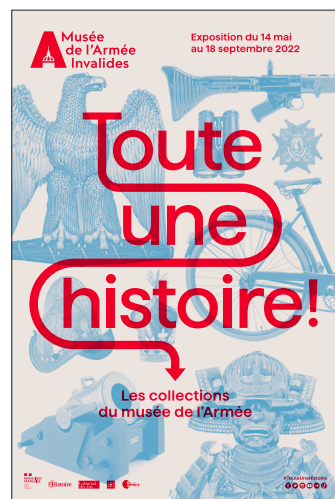
Affiche de l'exposition 'Toute une histoire ! Les collections du musée de l'Armée' © Graphisme Wijnje van Rooijen & Pierre Peronnet