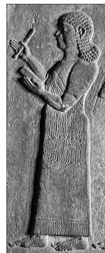
Détail d'un bas-relief d'un scribe (728 av. J.-C.) du Palais Central de Tiglat-Phalasar III à Nimrud

Accès en continu de 10h à 18h. Durée : 45 min. Atelier animé par le Centre national de recherches scientifiques (CNRS) et le Collège de France